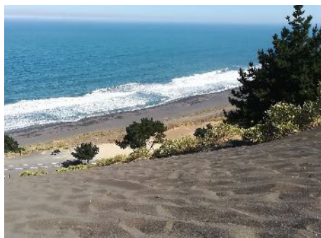
Cerro de Arena