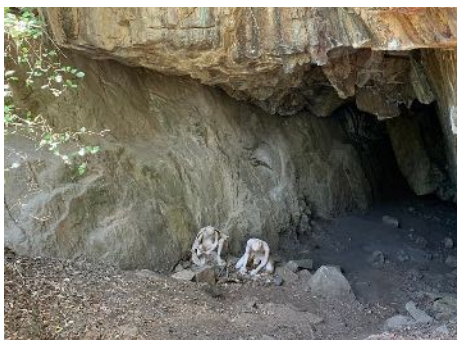
Cuevas de Quivolgo