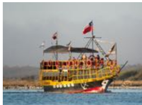
Paseo en bote por el Río Maule