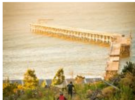
Balneario de Iloca y Caleta Duao