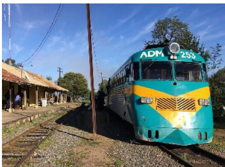
Tren Ramal Constitución