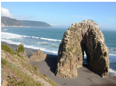
Piedra de la Iglesia y formaciones rocosas

En las cercanías de la ciudad destacan también las dunas y humedales de Putú , que conforman el campo de dunas más extenso del país, ideales para la práctica del ecoturismo.