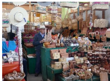
Mercado de Constitución